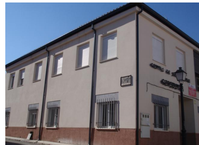
Instalaciones del Aula. Edificio Cervantes.

La enseñanza de adultos es gratuita. Está dirigida a mayores de 18 años, cumplidos en el año en el que comienza el curso (mayores de 16 años sujetos a condiciones especiales).